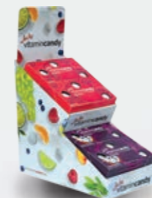
Stojak na 2 rodzaje