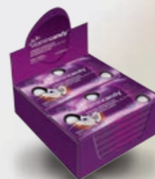
Opakowanie handlowe typu display à 12 blistrów