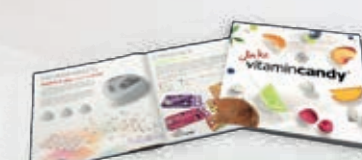
Foldery i reklama wizualna