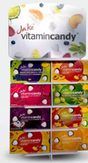
Stojak na 8 rodzajów