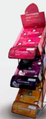
Stojak na 3 rodzaje