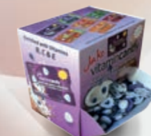
Opakowania handlowe à 180 szt. miniblistrów