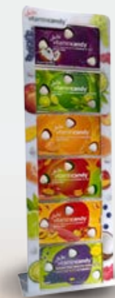
Stojak na 6 rodzajów