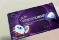
Karty z próbką (1 pastylka w miniblistrze)